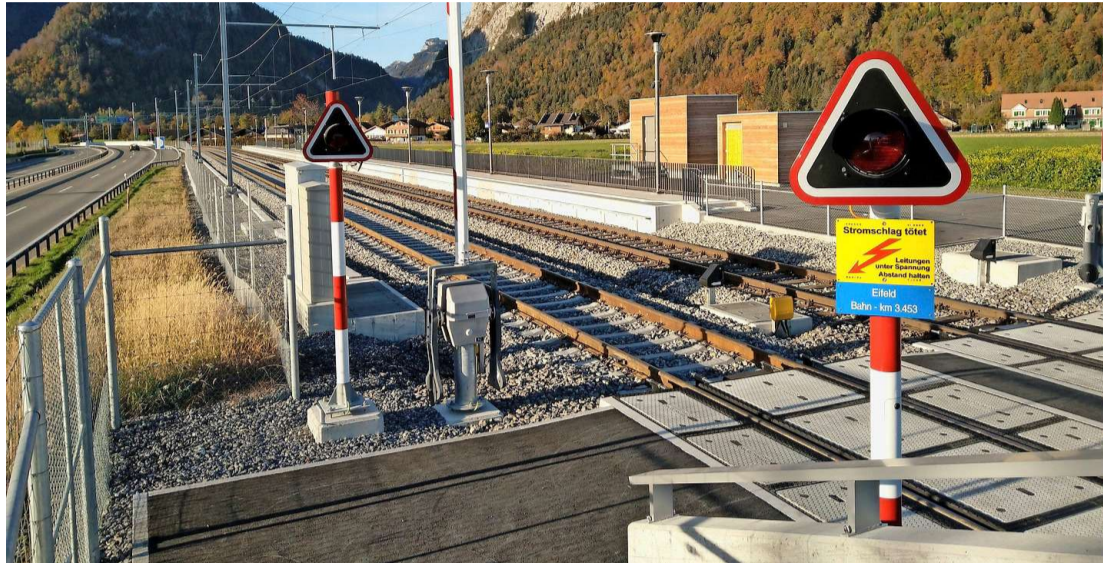
Die Halte- und Kreuzungsstelle Eifeld erfüllt das Behindertengleichstellungsgesetz und stabilisiert den Fahrplan.

Stefan Dauner präzisiert: «Neu wird der Regio Spiez immer um xx.12 verlassen, der Regioexpress immer um xx.38. In Zweisimmen wird der Regio immer um xx.02 abfahren, der Regioexpress immer um xx.39. Nur in den Randstunden gibt es Ausnahmen.» Auch im Eifeld halten die Züge ab dem 10. Dezember