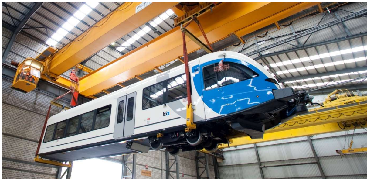
Verlad eines GTW von Stadler für die Bay Area Regional Transport (BART) in San Fransisco.