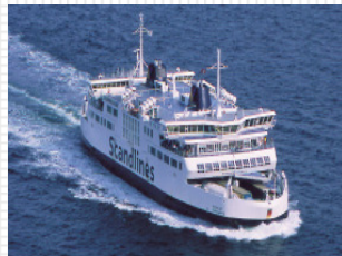
MS „Aurora“ 539 Lanemeter 600 Passagiere