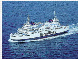
MS „Hamlet“ 553 Lanemeter 1.000 Passagiere