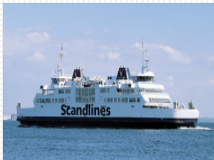
MS „Tycho Brahe“ 539 Lanemeter 1.250 Passagiere